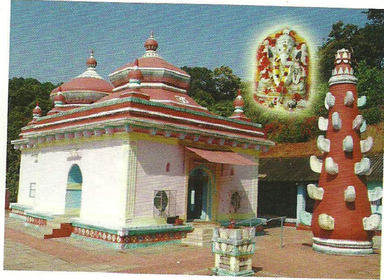
दशभुजा श्री गणेश (हेदवी)