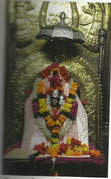
श्री महाकाली (आडिवरे)