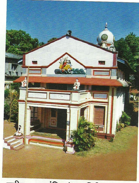
पतीतपावन मंदिर (रत्नागिरी)